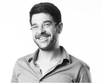
Štefan Kozák creativepro.sk, Bratislava (Slovensko)