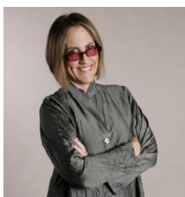
Martha Schwartz, Professor Harvard University School of Design / MSPartners.com, Boston (USA)